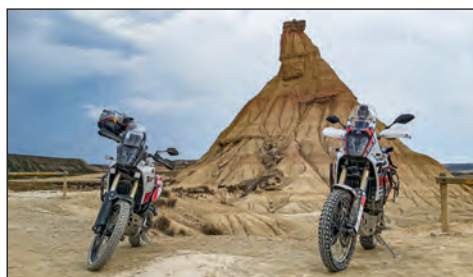
RAID TÉNÉRÉ BARDENAS Les Yamaha reprennent un peu de désert...