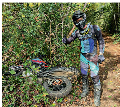
#2 On a beau être jeune et talentueux, la chute n'épargne personne. Non mais, il y a une justice quand même !