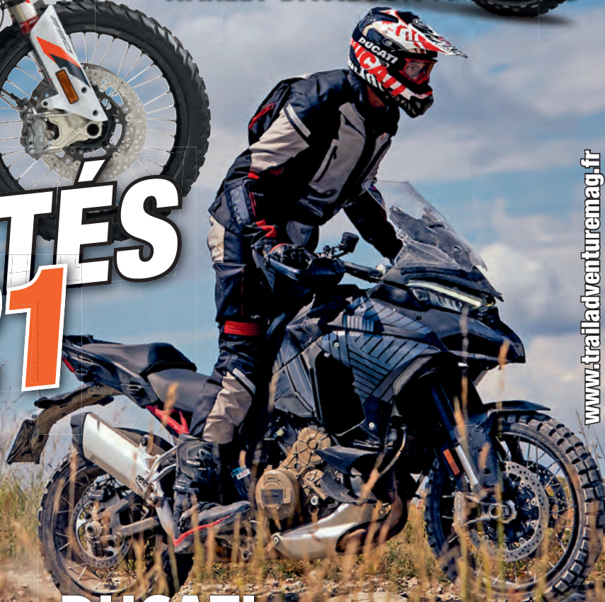
DUCATI Multistrada V4