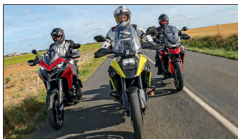
COMPARATIF Ducati Multistrada - Suzuki V-Strom - Triumph Tiger