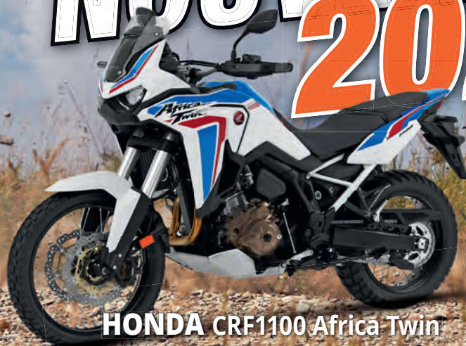
HONDA CRF1100 Africa Twin