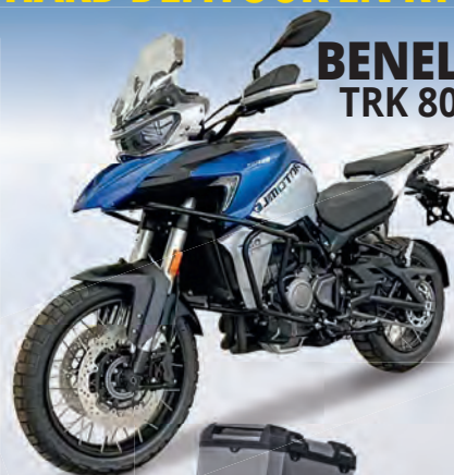
BENELLI TRK 800