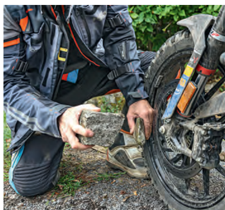
#1 Les jantes à bâtons ont souffert. Hervé a dû détordre l'une d'entre elles avec les moyens du bord.

Plus tard, sur l'autoroute qui me ramène au bercail, les pierres, les racines et les arbres continuent à défiler dans ma tête. Nous en avons tellement bouffé durant ces deux