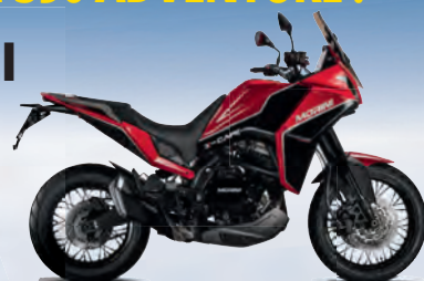
MOTO MORINI X-Cape 650