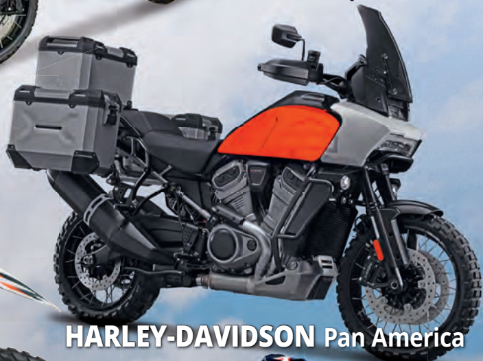
HARLEY-DAVIDSON Pan America