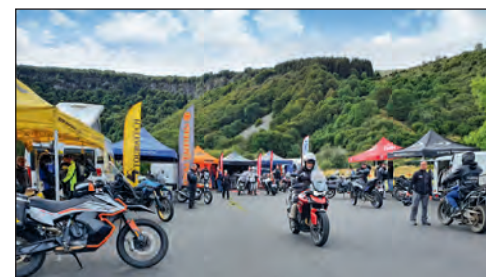
TRAIL ADVENTURE DAYS L'événement trail qui monte en puissance !