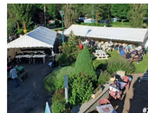
#1 Parc fermé le vendredi soir pour les participants du Hard-Défitour. L'organisation est décontractée mais toujours sérieuse.